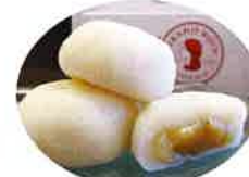
いちじく大福「北限のにかほ美人」