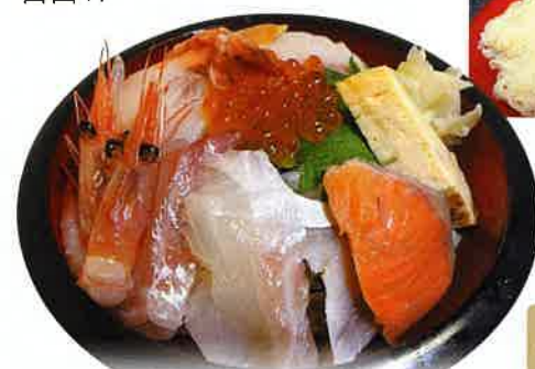
海鮮丼 地元産魚介類を中心に取り入れた逸品

にかほ陣屋特製の干物定食や海鮮丼は鮮度も良く人気メニュー！秋田名物稲庭うどんなどメニューも豊富でご飯、みそ汁おかわり自由！！