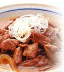
ホルモン煮込み 大将名物 鍋買いホルモン