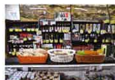
秋田のお酒、地元のお酒(飛良泉・天寿・雪の茅舎)も取り扱っております。