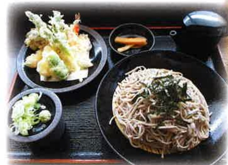
天ざる 季節毎に変わる天ぷらと二八蕎麦

地元上郷で採れた蕎麦を使用。製粉からの手作り作業。そばの味わいを追求し、また地元食材の天ぷらも大人気！！