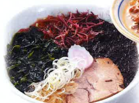
大将ラーメン 生わかめ・ふのり・あおさが乗った「海の幸ラーメン」

日本海で採れた昆布ダシのラーメンや焼肉定食セットが大好評！！特に、「生わかめ」たっぷりの大将ラーメンはおすすめ。