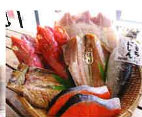
手作り干物セット