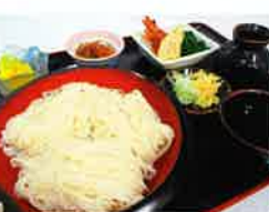
稲庭うどん 日本三大うどんのひとつに数えられる秋田名物